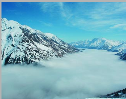
2. Белая река. Северный склон Чегета Бушуев Никита, СДК «Гарант»