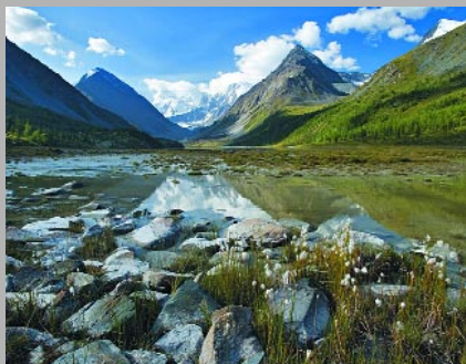
5. Ак-Кемское озеро. Горный Алтай Латшин Михаил, ОАО АБ «Кузнецкбизнесбанк»