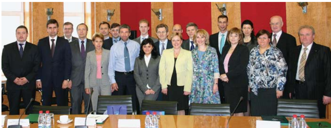
Участники Общего собрания членов НДЦ